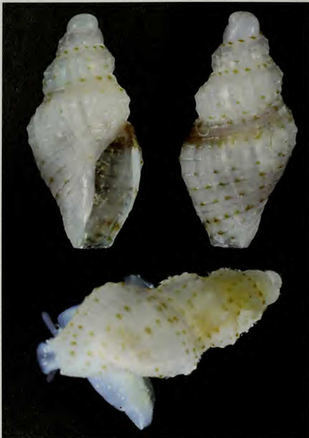
Lámina 2.- Steironepion delicatus , especie nueva.